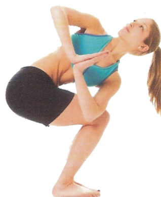
⑭ Postura Torcida da Cadeira (Parivrtta Utkatasana), p. 124-125