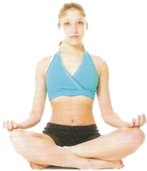
● Postura Fácil (Sukhasana), p. 22