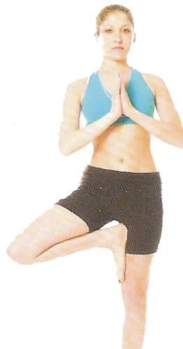
⑥ Postura da Árvore (Vrksasana), p. 38–39