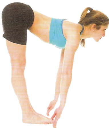
⑪ Meia Postura do Alongamento Intenso para a Frente (Ardha Uttanasana), p. 67