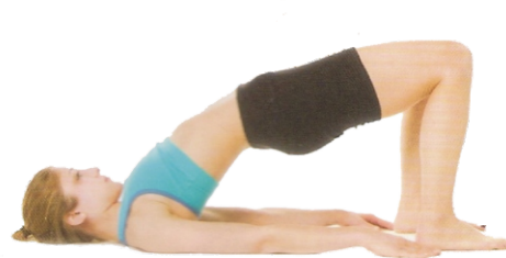
⑩ Postura da Ponte (Setu Bandhasana), p. 86-87