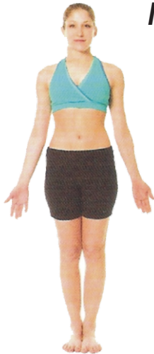
① Postura da Montanha (Tadasana), p. 32