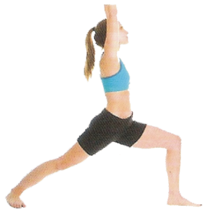
⑨ Postura do Guerreiro I (Virabhadrasana I), p. 54–55