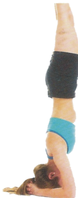
⑱ Postura com Apoio sobre a Cabeça (Salamba Sirsasana), p. 144-145