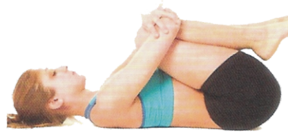
Postura de apana (apanasana)