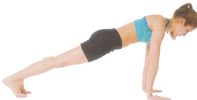
④ Postura da Prancha, p. 134